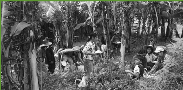
Miembros de la asociación de agricultores locales plantando en un sitio piloto de 20 hectáreas, iniciativa Quirino, Filipinas.

para asegurar que las preocupaciones de los interesados se traten adecuadamente. A nivel nacional, dicho programa debería asegurar la divulgación de información adecuada al público en general, a todas las agencias del gobierno y al sector privado sobre los enfoques nacionales y locales para REDD+. A nivel local, el programa debe prever la participación y vinculación apropiada de todos los grupos de interés locales (incluidas las comunidades locales, pueblos indígenas, campesinos, propietarios individuales, colonos ilegales, etc.) que pueden impactar o ser impactados por las políticas y actividades gubernamentales de REDD+. El programa de divulgación debe incluir actividades de capacitación para que los actores locales tengan las habilidades y capacidades para participar en las iniciativas de carbono forestal, y debe contar con mecanismos claros para brindar actualizaciones regulares sobre políticas y actividades de REDD+, así como posibilitar recibir aportes y responder a los interesados.