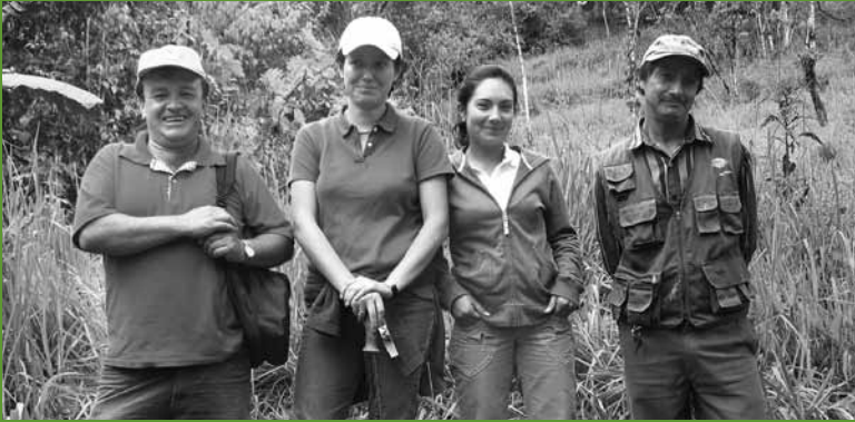
Staff de CI con un socio local, la fundación Maquipucuna, durante una visita de campo al proyecto CHOCO 2 , Ecuador.

Enfocamos nuestro análisis en cinco temas principales que serán críticos para el éxito de REDD+: 1) creación de alianzas eficaces y con suficiente capacidad; 2) asegurar que las iniciativas de carbono forestal estén respaldadas por análisis técnicos y científicos rigurosos; 3) atraer recursos financieros necesarios para el desarrollo; 4) participación exitosa de los actores locales en el diseño y ejecución de las iniciativas, y 5) garantizar el apoyo activo del gobierno en las actividades de campo. Para cada uno de estos aspectos, proporcionamos información general sobre la forma en que las 12 iniciativas de carbono forestal han tratado estos temas, resaltando los retos y las oportunidades encontradas desde la perspectiva de los gestores de proyectos y de los socios participantes. Además ofrecemos recomendaciones clave tanto para los gestores de las iniciativas de