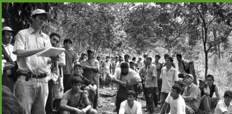
Reunión para involucrar a los actores locales en la iniciativa REDD+ en Alto Mayo, Perú.

Una variedad de factores han facilitado la recaudación de fondos para las iniciativas de carbono forestal. Todas las iniciativas han sido específicamente diseñadas para generar co-beneficios ambientales y sociales adicionales a los climáticos, lo que ha demostrado ser útil para atraer a los donantes e interesar a los inversionistas. Demostrar que las iniciativas de carbono forestal son científicamente rigurosas, bien diseñadas y respaldadas por una gran experiencia técnica, también ha favorecido la inversión. En algunos casos, el desarrollo de iniciativas piloto de pequeña escala (por ej. actividades de reforestación de pequeña escala) también ha atraído inversionistas, al demostrar en el campo que las actividades son viables y al proporcionar