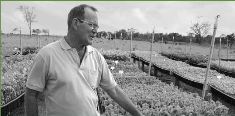
El encargado del vivero del socio local, Oreades, explica la selección de plantones para la iniciativa Emas, Brasil.

de política, para garantizar su apoyo y aceptación. Si es oportuno, alentar al gobierno a incluir las iniciativas de carbono forestal en sus políticas públicas, para garantizar apoyo y financiación a largo plazo.