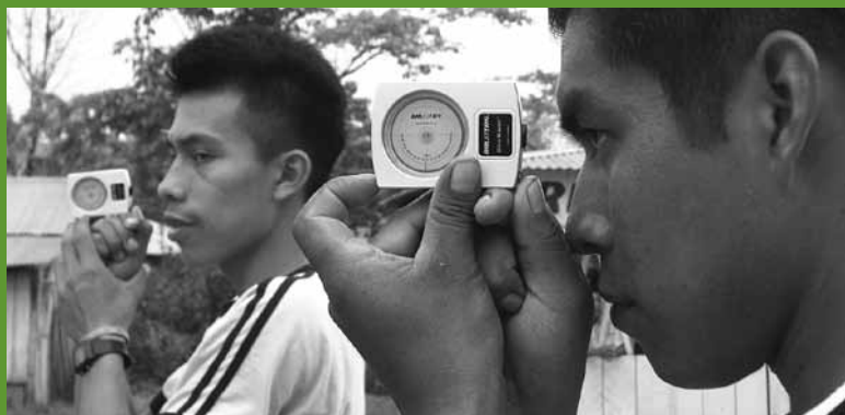
Entrenamiento para el desarrollo de inventarios forestales a miembros de la comunidad local de la Selva Lacandona, México.

Si bien los gobiernos han sido de apoyo, todas las iniciativas de carbono forestal periódicamente han encontrado dificultades al trabajar con los gobiernos. Estas dificultades han surgido principalmente por la falta de políticas nacionales y regulaciones claras de cambio climático, que orienten el diseño y la ejecución de las actividades de carbono forestal en el campo, en particular REDD+, y la falta de claridad respecto a los derechos de carbono. En casi la mitad de las iniciativas, la falta de claridad sobre la tenencia y los derechos de uso de la tierra también han sido una barrera crítica. Otro problema frecuente ha sido la falta