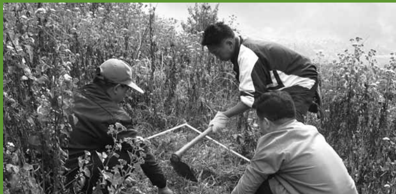
Tomando muestras de biomasa herbácea en la iniciativa Tengchong, China.

por el carbono sólo se obtendrán después de que los créditos de carbono se hayan generado y verificado, así que normalmente existirá en un lapso de varios años entre el inicio de las actividades de campo y la generación de fondos del carbono. Estos aspectos deben ser considerados cuidadosamente en el diseño del presupuesto y en la coordinación de las actividades de recaudación de fondos.