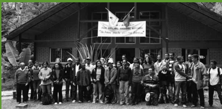
Visita de campo al parque nacional Mantadia, como parte del taller para el desarrollo de proyectos de carbono forestal en Madagascar.