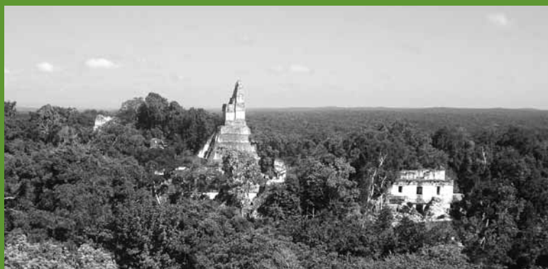
El sitio arqueológico de Tikal, localizado en la reserva de la Biosfera Maya, Peten Guatemala .