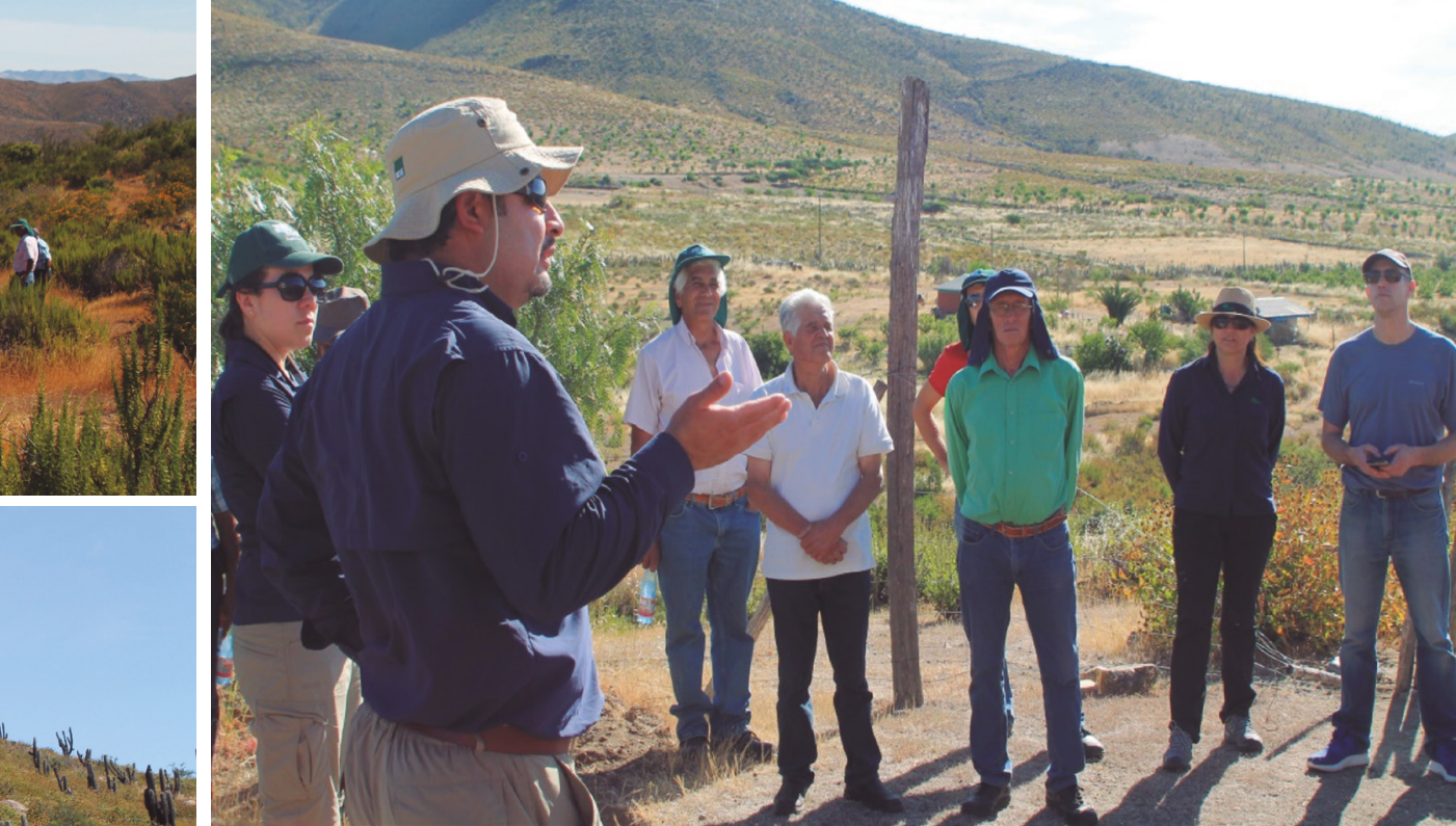
Figura 5. Intercambio de opiniones entre los asistentes a la Gira y los Comuneros, sobre las actividades realizadas en el proyecto de la Comunidad Agrícola de Cerro Blanco.