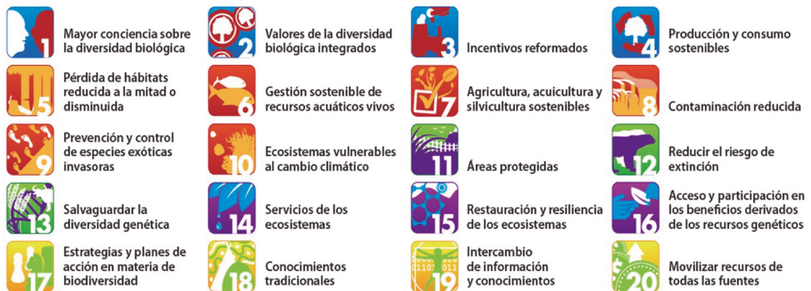
Figura 2. Esquema de Metas de Aichi para diversidad biológica 4 .