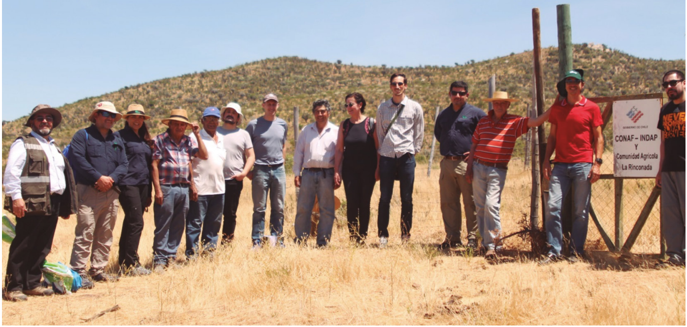
Figura 4. Visita de campo a la zona de Escorza, propiedad de la Comunidad Agrícola de Rinconada de Punitaqui. En el letrero se observa la iniciativa modulada por un convenio entre CONAF, INDAP y la comunidad.