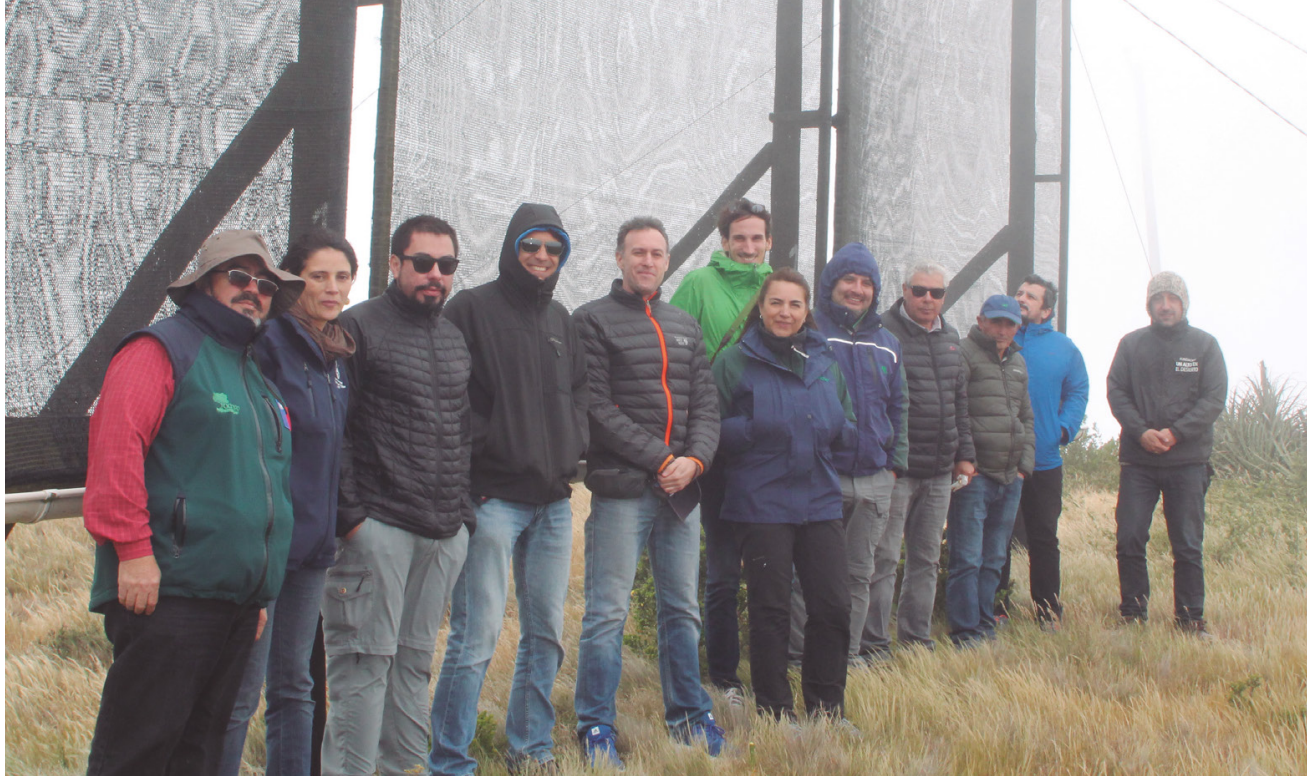
Figura 6. Cima del Cerro Grande, zona de exclusión en la cual se realiza cosecha de agua para diferentes fines establecidos por la Comunidad Agrícola de Peñablanca.